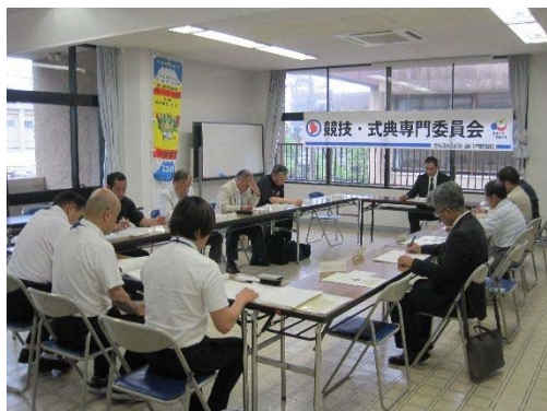
第3回：川内文化ホール