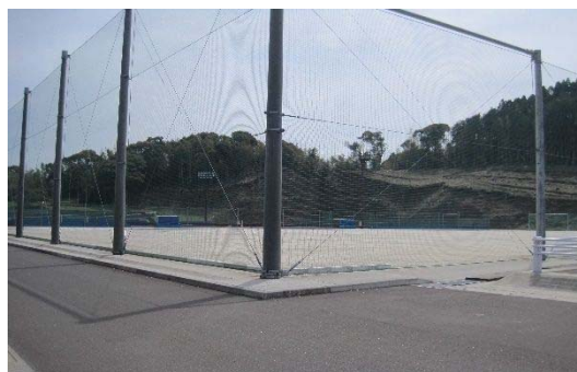
樋脇屋外人工芝競技場クレーコート