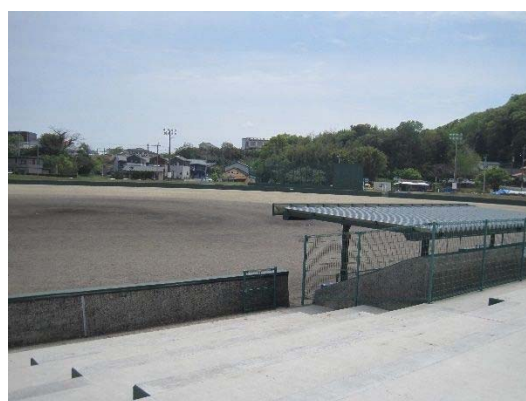
御陵下公園野球場