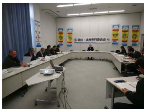
第5回：サンアリーナせんだい