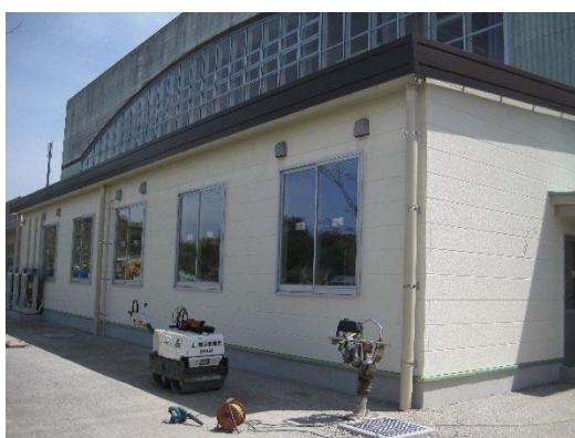
入来総合運動場体育館ウエイトリフティング室