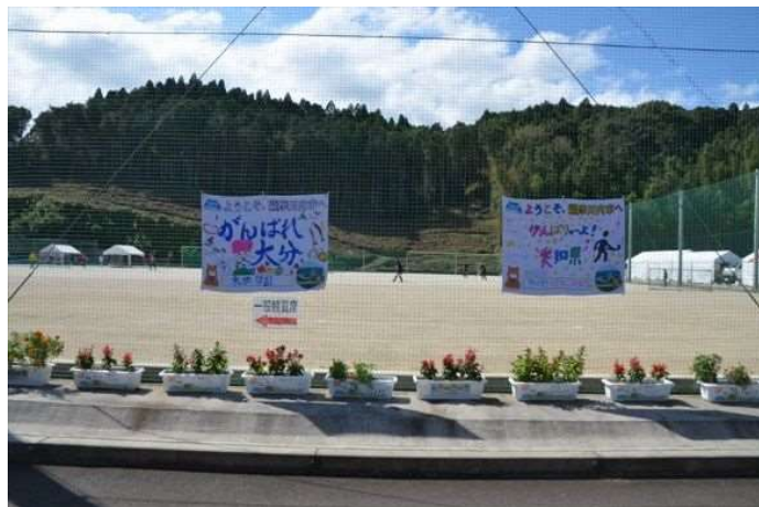
イ WELCOME FLOWER事業