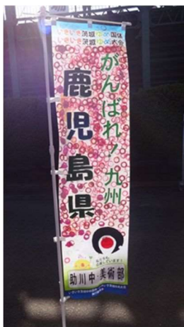
ア 応援のぼり旗作成