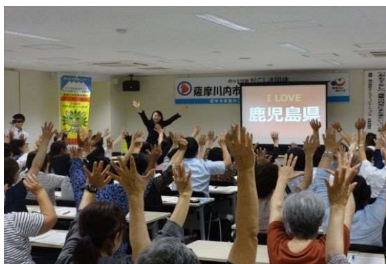
(3) おもてなしマナー講座