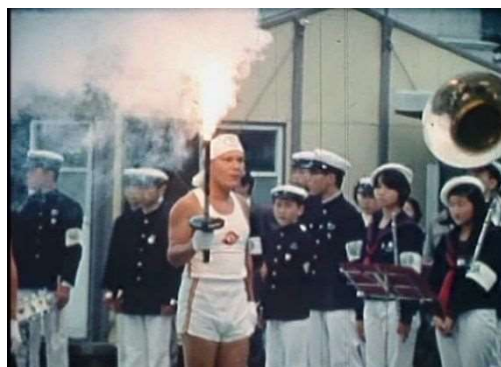
エ 炬火リレー（太陽国体）