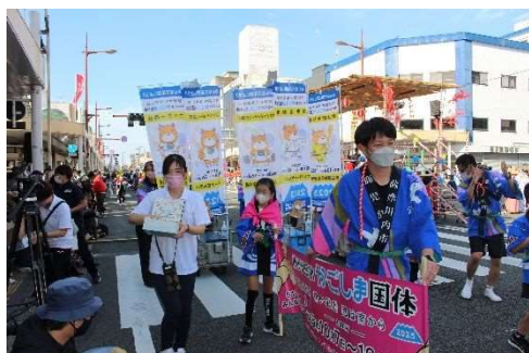
3 PRグッズ配布（はんや祭）