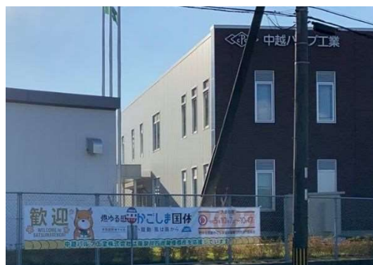
2 国体横断幕（企業協賛）