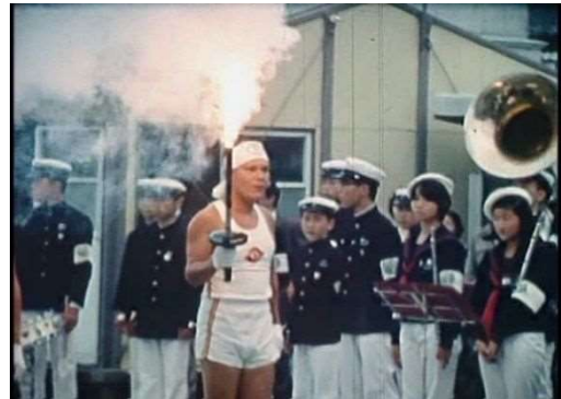
エ 炬火リレー（太陽国体）