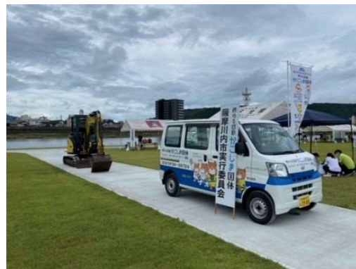
イ 広報ラッピング