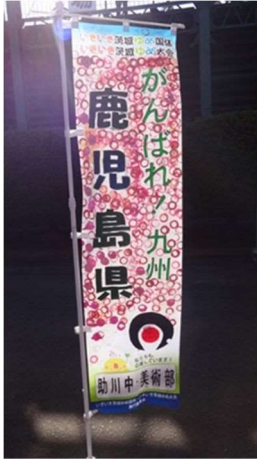
ア 応援のぼり旗作成