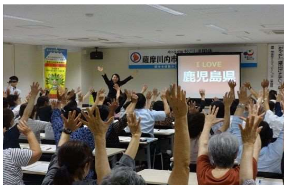
(3) おもてなしマナー講座