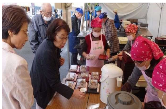
(4) ふるまい品の提供