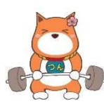
ウェイトリフティング