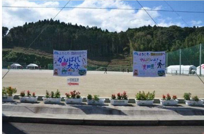
イ WELCOME FLOWER事業